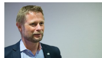
Høyre avviser krav om vaksinegransking