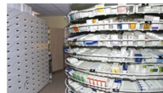
Fusjonert innkjøpsgigant skal handle til sykehusene for ti milliarder